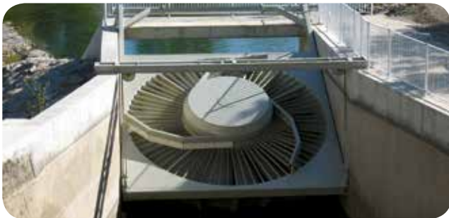
▷ Exemple de VLH (4,5 m de diamètre - 410 kW sous 2,5 m de chute brute), © MJ2 Technologies