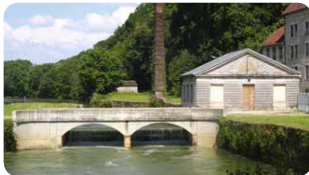
➤ L'installation actuelle avec les 2 groupes VLH immergés et le local technique réaménagé