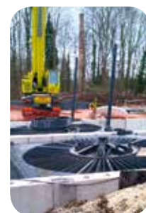
➤ Pose des deux groupes VLH en décembre 2011