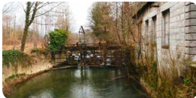
➤ L'ancienne installation hydroélectrique avant transformation

Puissance installée : 400 kW Hauteur de chute nette : 1,77 m Production attendue : 2 085 000 kWh/an