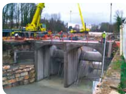
➤ A l'intérieur de la propriété, le pont de circulation a été démolé puis reconstruit afin de modifier la taille de la pile centrale et permettre une meilleure circulation de l'eau dans les VLH