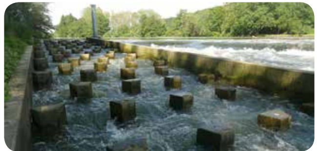
▷ La passe à poissons de type rampe partielle avec enrochements régulièrement répartis

Cette passe a été préférée au type « passe à bassins successifs » en raison du transit d'une plus large variété d'espèces piscicoles, d'un bon fonctionnement quel que soit le niveau d'enneigement aval et d'un entretien réduit. L'intégralité du fond de la rampe est pavée pour éviter l'érosion et augmenter la rugosité. Pour que les poissons trouvent cette passe, il a été décidé de l'implanter en rive droite en amont du barrage et d'y injecter un minimum de 800 l/s (pour un débit de 11 m 3 /s dans le tronçon court-circuité). Des échancrures positionnées en rive droite du seuil complètent le dispositif de circulation piscicole. Le coût de la passe est de 360 000 € HT.