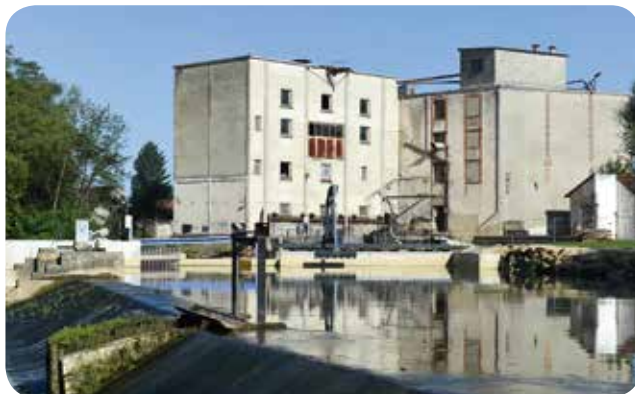
▷ Vue du site après travaux