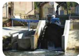
▷ Mise en place de la vis hydrodynamique