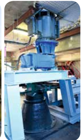
▷ Multiplicateur de vitesse et génératrice