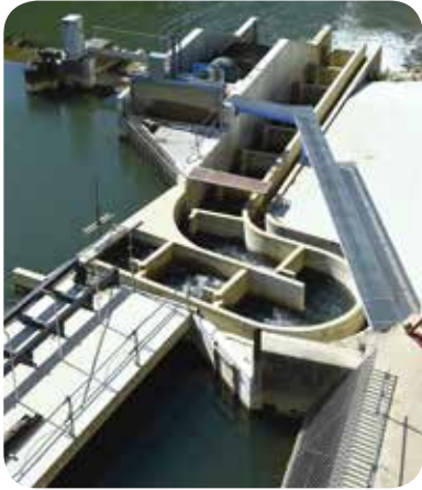
▷ Passe à poissons

Pour la montaison, la passe à poissons existante n'était pas satisfaisante. La construction d'une nouvelle passe à poissons a été combinée avec la mise en place de la vis hydrodynamique, reconnue pour son caractère ichtyocompatible. Les remous de la vis rendent l'entrée de la passe à poissons attractive (débit de la passe à poissons : 0,6 m 3 /s – débit turbiné de la vis : 4 m 3 /s – débit de la goulotte : 0,4 m 3 /s).