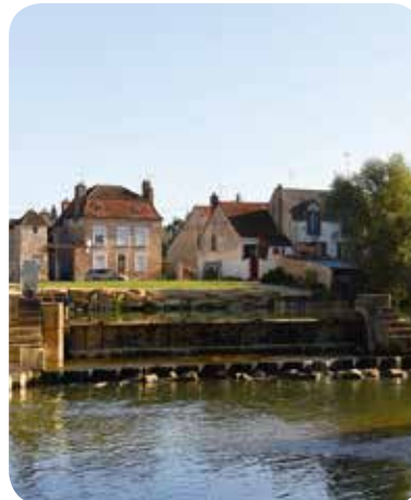
▷ Clapet et vanne de décharge

Le clapet et la vanne de dégravage existants ont été automatisés afin d'optimiser le transport des sédiments.