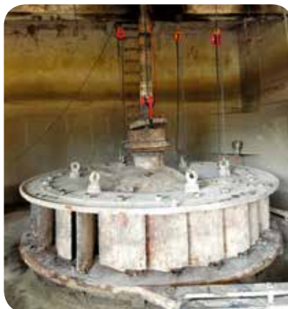
▷ Turbine Francis en cours de rénovation