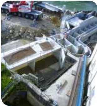
▷ Vues d'ensemble pendant les travaux

L'implantation de la vis hydrodynamique sur le côté du barrage permet d'augmenter significativement la valeur du débit réservé qui circule dans la rivière (passage de 3 à 5 m 3 /s) et favorise l'intégration environnementale de l'ensemble du projet.