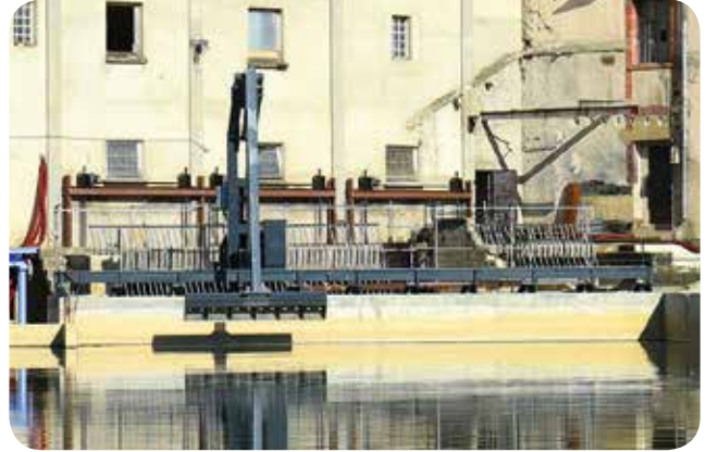
▷ Prise d'eau ichtyocompatible et dégrilleur

En raison de l'enclavement des trois prises d'eau des turbines existantes et de la quasi-impossibilité de les rendre ichtyocompatibles, il a été réalisé une seule prise d'eau en amont des trois existantes, couplée à la mise en place de grilles à tête de poisson avec espace inter-barreaux de 20 mm, associées à des exutoires de dévalaison. L'ensemble de ces aménagements permet aux poissons de parcourir la centrale sans difficulté.